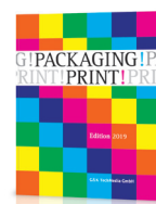
Sonderpublikationen – themen- und firmenbezogen