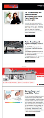
Weekly Newsletters Special Newsletters Stand-Alone Newsletter White Papers